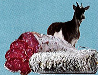
Au fromage de Chèvre