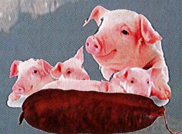
Pur Porc Fumé